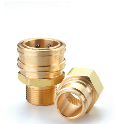
BSPP Enchufe y adaptador.