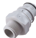
HFC24 Rosca macho.