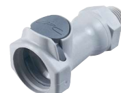
HFC10 Rosca macho.

En caso de interesar la rosca NPT, especificar NPT después de la referencia.