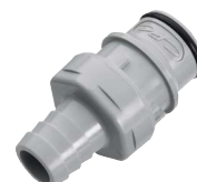
HFC22 Espiga manguera.