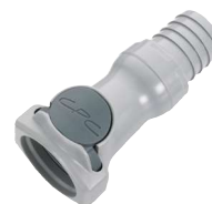
HFC17 Espiga manguera.