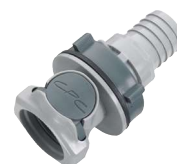
HFC16 Espiga manguera. Montaje panel.