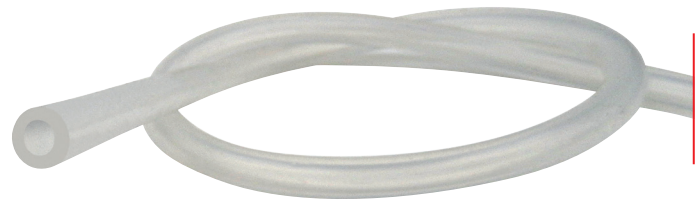
TUBO EXTRUIDO DE SILICONA PERÓXIDO