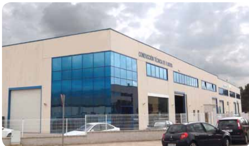
ACCESFLUID - Sede central

La puesta en marcha del nuevo ASSEMBLY CENTER consolida nuestro posicionamiento en el sector y refuerza nuestro compromiso de servicio con nuestros clientes.