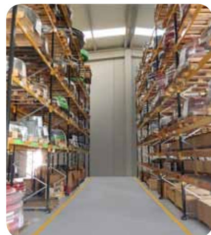
ASSEMBLY CENTER - Almacén