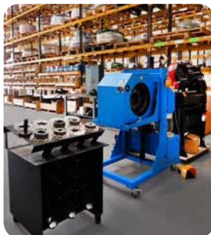
ASSEMBLY CENTER - Prensado